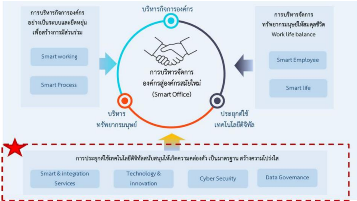
รูปภาพที่ 1 แนวคิดการดำเนินงานด้านเทคโนโลยีดิจิทัลของสกพอ.

เป้าหมาย : การประยุกต์ใช้เทคโนโลยีดิจิทัลสนับสนุนให้เกิดความคล่องตัว เป็นมาตรฐาน สร้างความโปร่งใส