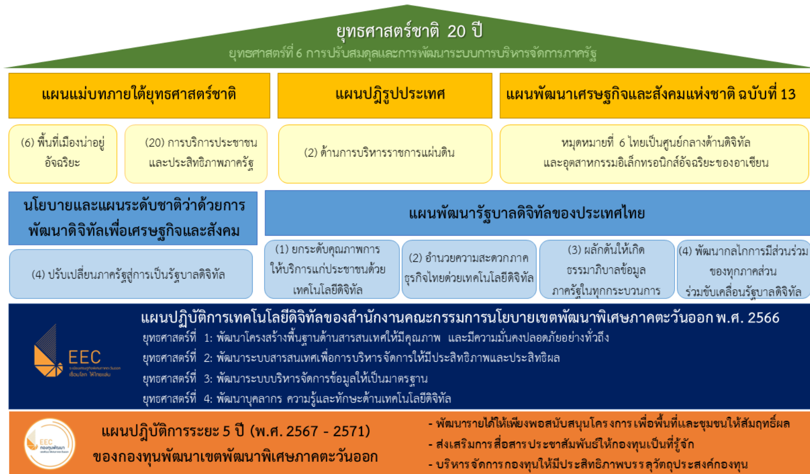
รูปภาพที่ 3 ความเชื่อมโยงแผนปฏิบัติการดิจิทัลระยะยาวของกองทุนกับนโยบายและแผนด้านสารสนเทศของประเทศ แผนด้านสารสนเทศของ สกพอ.

แผนปฏิบัติการดิจิทัลระยะ 5 ปี (พ.ศ. 2567 - 2571) และแผนปฏิบัติการดิจิทัล ประจำปีบัญชี 2568